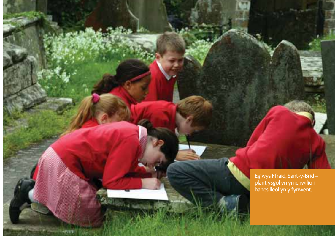
Eglwys Ffraid, Sant-y-Brid – plant ysgol yn ymchwilio i hanes lleol yn y fynwent.

Mae'n wir bod Cyngorau Cymuned ac Adurdodau Lleol, mewn rhai lleoedd, yn cynnig grantiau, ond bydd yn rhaid wrth fwy o gymorth os yw ein mynwentydd i barhau i wasanaethu cymunedau Cymru.