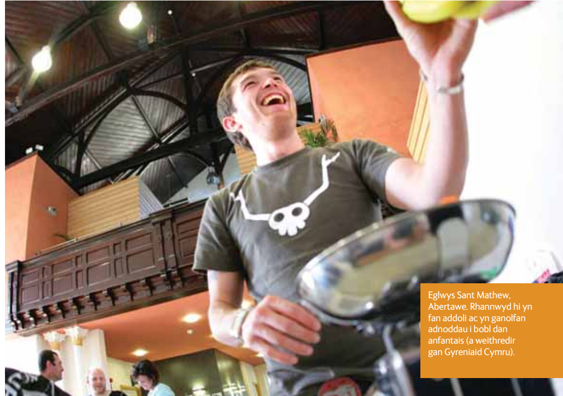
Eglwys Sant Mathew, Abertawe. Rhannwyd hi yn fan addoli ac yn ganolfan adnoddau i bobl dan anfantais (a weithredir gan Gyreniaid Cymru).

Yn gynyddol, yr eglwys yw'r unig adeilad cyhoeddus sydd ar ôl yn y gymuned, ac y mae ganddo ran allweddol mewn cynorthwyo i ysbrydoli a thrawsffurfio cymunedau a chynulleidfaoedd.