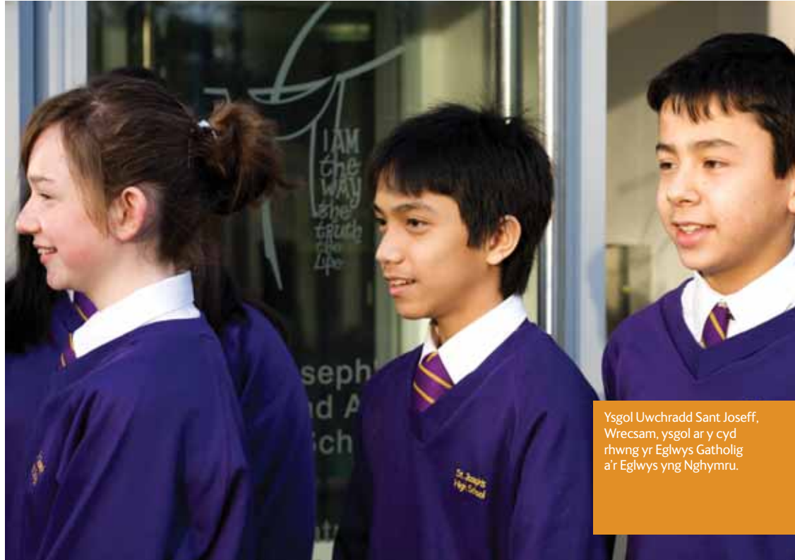
Ysgol Uwchradd Sant Joseff, Wrecsam, ysgol ar y cyd rhwng yr Eglwys Gatholig a'r Eglwys yng Nghymru.

Mae ein hysgolion yn ymrwymedig i gynorthwyo pob plentyn i gyflawni ei botensial llawn mewn amgylchedd myfyrgar sy'n ei dderbyn ac yn rhoi cyfeiriad a phwrpas i'w fywyd. Yn y byd sydd ohoni, y mae agweddau ac ysbrydoledd, gwerthoedd a dyheadau, yr un mor bwysig â medrau technegol.