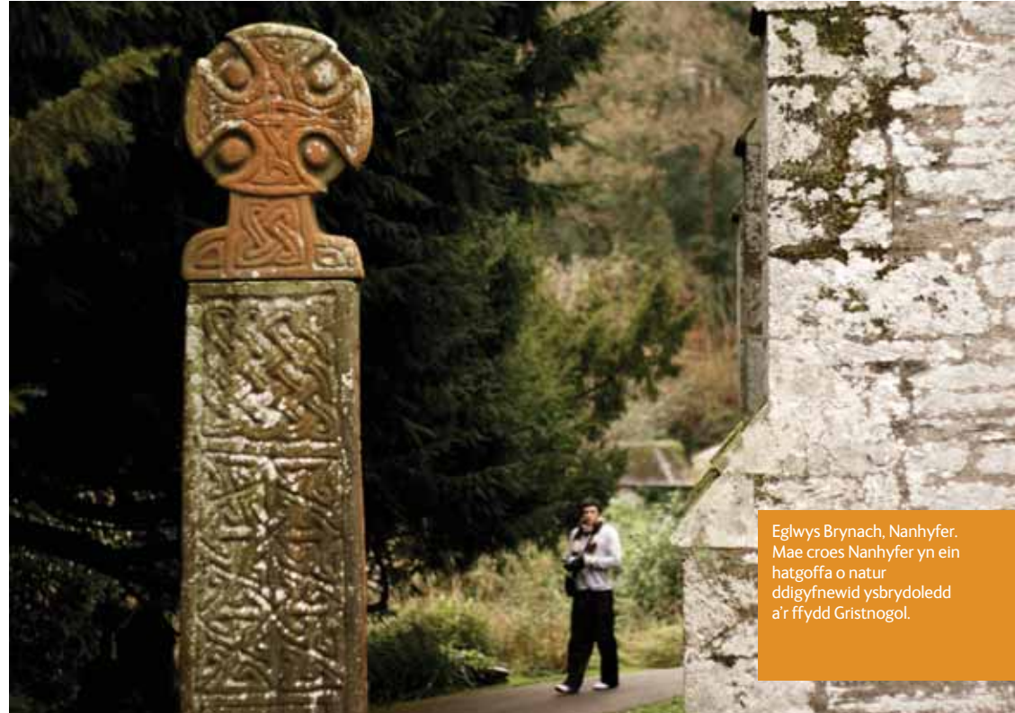
Eglwys Brynach, Nanhyfer. Mae croes Nanhyfer yn ein hatgoffa o natur ddigynfnewid ysbrydoledd a'r ffydd Gristnogol.

Y mae croeso i bawb – wrth galon addoli y mae cariad Duw at bob un. Wrth inni ymateb i'r cariad hwn mewn ffyrdd newydd a gwahanol, yr ydym yn cyfrannu at drawsnewid mudiadau a chymunedau ledled Cymru ac yn darganfod mwy o'r hyn a eilw'r Beibl yn 'gyflawnder bywyd'.